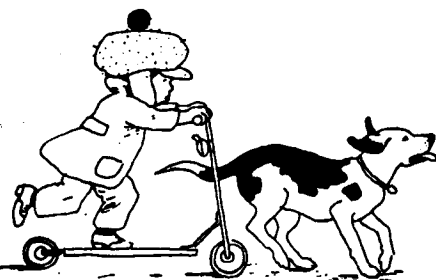
op z'n tijd de pas weten in te houden!